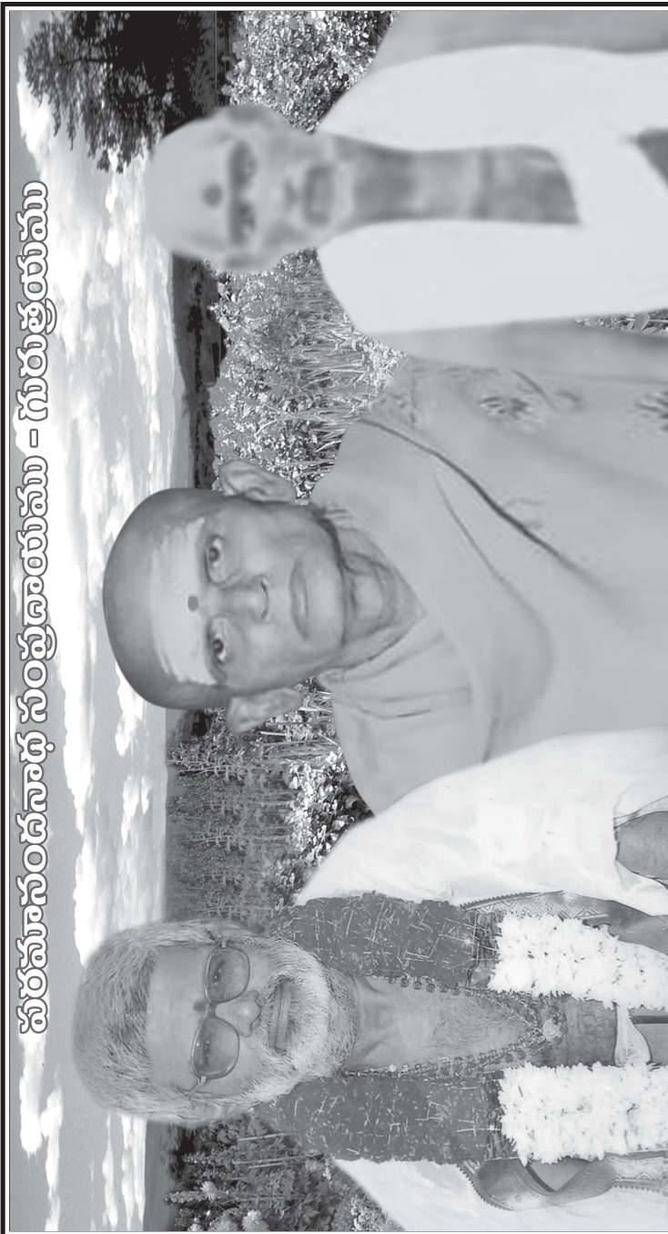
పరమానందనాథ సంప్రదాయము - గురుత్రయము